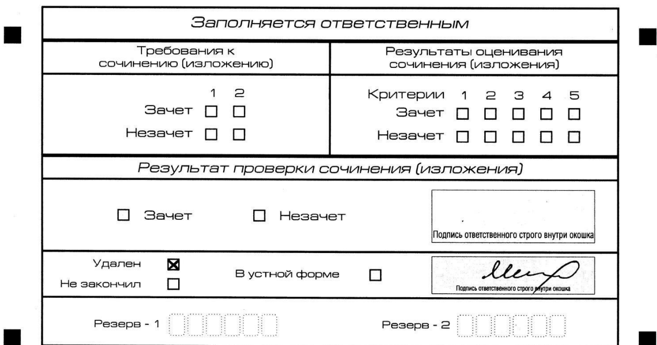
Рис. 13. Заполнение полей нижней части бланка регистрации (удаление с экзамена)

В случае если участник итогового сочинения (изложения) нарушил установленные требования, изложенные в пункте 28 Порядка проведения государственной итоговой аттестации по образовательным программам среднего общего образования (приказ Минпросвещения России и Рособрнанадзора от 4 апреля 2023 г. № 232/551), он удаляется с итогового сочинения (изложения). Член комиссии по проведению итогового сочинения (изложения) составляет «Акт об удалении участника итогового сочинения (изложения)» (форма ИС-09), вносит соответствующую отметку в форму ИС-05 «Ведомость проведения итогового сочинения (изложения) в учебном кабинете ОО (месте проведения)» (участник итогового сочинения (изложения) должен поставить свою подпись в указанной форме). В бланке регистрации указанного участника итогового сочинения (изложения) необходимо внести отметку «X» в поле «Удален». Внесение отметки в поле «Удален» подтверждается подписью члена комиссии по проведению итогового сочинения (изложения) (см. рис. 13).