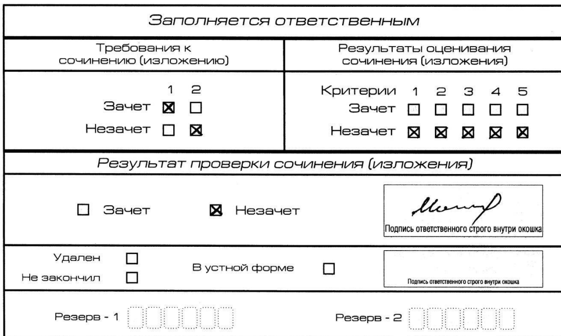
Рис. 9. Область для оценки работы

Если итоговое сочинение (изложение) соответствует требованию № 1 и требованию № 2, то выставляется «зачет» за выполнение требования № 1 и требования № 2. Указанные сочинения (изложения) далее оцениваются по критериям.