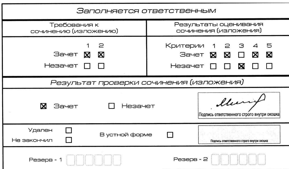
Рис. 10. Область для оценки работы

3. Во всех остальных случаях итоговое сочинение (изложение) проверяется по всем пяти критериям и оценивается по системе «зачет»/«незачет».