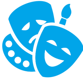
Логотип трека «Орлёнок – Мастер»

Ценности, значимые качества трека: познание