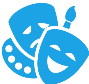
Логотип трека «Орлёнок – Мастер»

Ценности, значимые качества трека: познание, творчество, красота